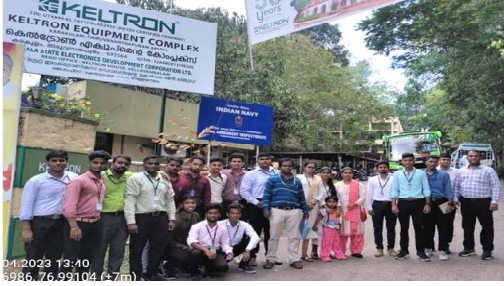
Industrial visit by Keltron Kerala State Electronics Company

केरळ येथे औद्योगिक अभ्यास दौरा: महाविद्यालयातील इलेक्ट्रॉनिक्स व टेलिकम्युनिकेशन अभियांत्रिकी विभाग तसेच इन्स्ट्रुमेंटेशन अभियांत्रिकी विभागाचा सहभाग.